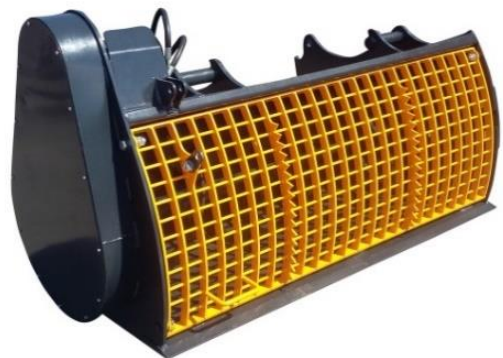
Messer am Gitter zum aufreißen vom Betonsack