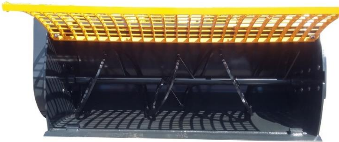
Mischer aus Hardox