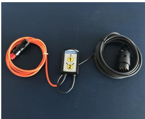
12 Volt Steuerung vom Umstellventil